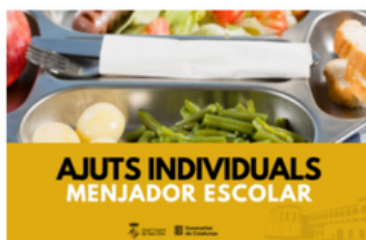
Ajuts de menjador 2024/2025